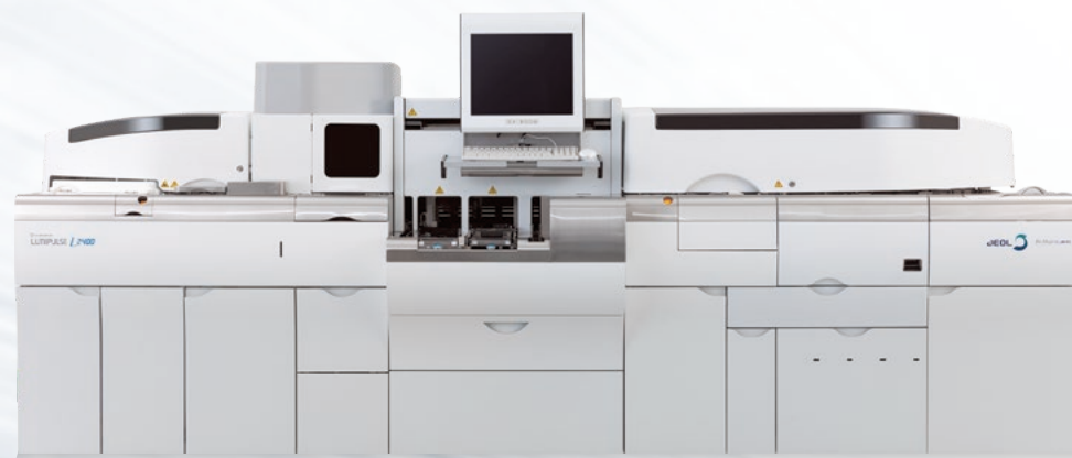
免疫発光測定装置 LUMIPULSE® L2400

製品に関する情報は弊社HPにて 多数掲載しております 携帯やスマートフォンの場合は こちらからご覧いただけます