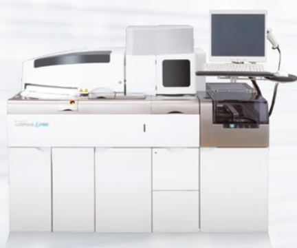
免疫発光測定装置 LUMIPULSE® L2400