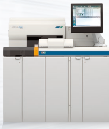
免疫発光測定装置 LUMIPULSE® G1200 Plus