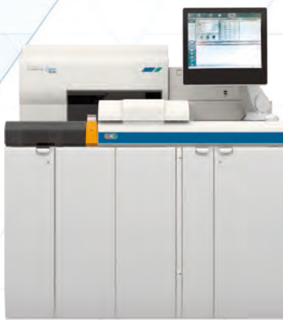
免疫発光測定装置 LUMIPULSE® G1200 Plus