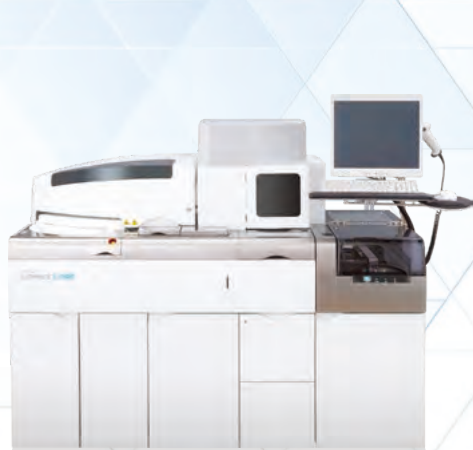
免疫発光測定装置 LUMIPULSE® L2400