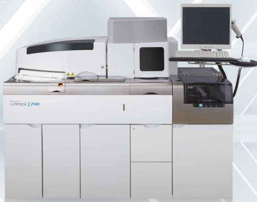
免疫発光測定装置 LUMIPULSE® L2400