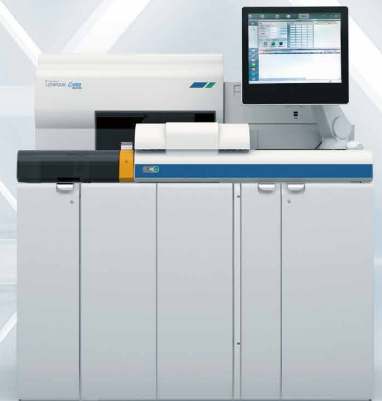
免疫発光測定装置 LUMIPULSE® G1200 Plus+