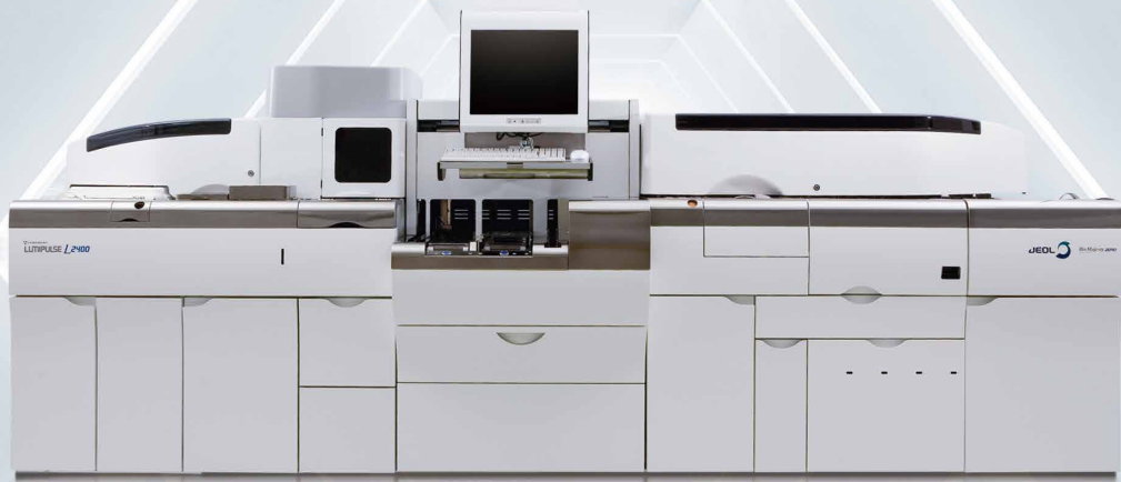
免疫発光測定装置 LUMIPULSE® L2400