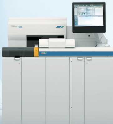
NEW 免疫発光測定装置 LUMIPULSE ® G1200 Plus