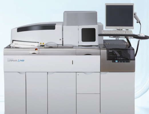
免疫発光測定装置 LUMIPULSE ® L2400