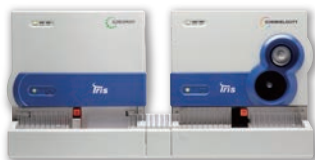
アイキュー 200 スプリント アイケムヴェロシティ